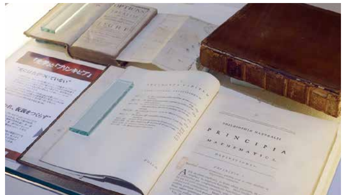
ニュートンの『プリンキピア』(全集版 1779 年)