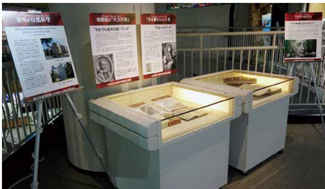
標本館 2 階での連携ミニ展示のようす