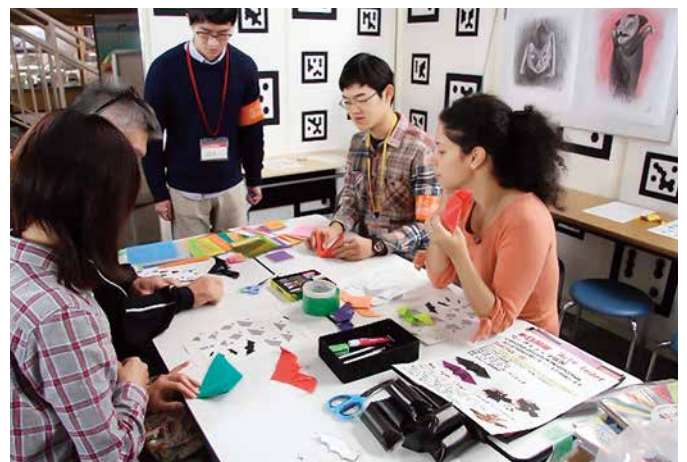
「折り紙の日にコウモリおりがみ!」