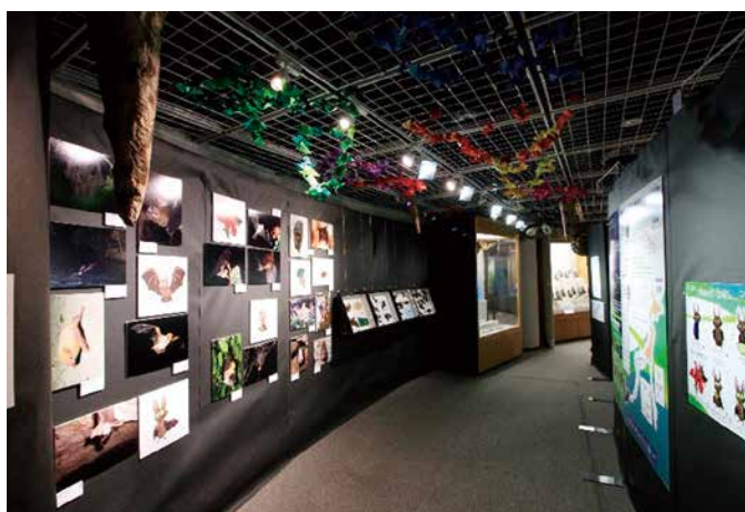
展示スペース内部のようす

内容については、キューバと日本にはそれぞれ多種多様なコウモリが生息し、食性も棲むところも違うこと、生態系でも重要な位置を占めること、そしてコウモリのなかには絶滅に瀕した種がたくさんいることなどをわかりやすく学んでもらえるよう心がけました。展示スペースは洞窟に見立てた装飾をして、約50標本、18枚の生態写真、解説パネルなどを設置しました。天井から