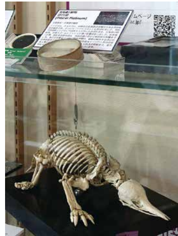
昨年展示のハリモグラ骨格標本

3館園合同展「大学を探検しよう！」(仮) 会期：2019年7月1日(月)～19日(金) 会場：東北大学附属図書館本館 エントランス展示スペース ★観覧無料