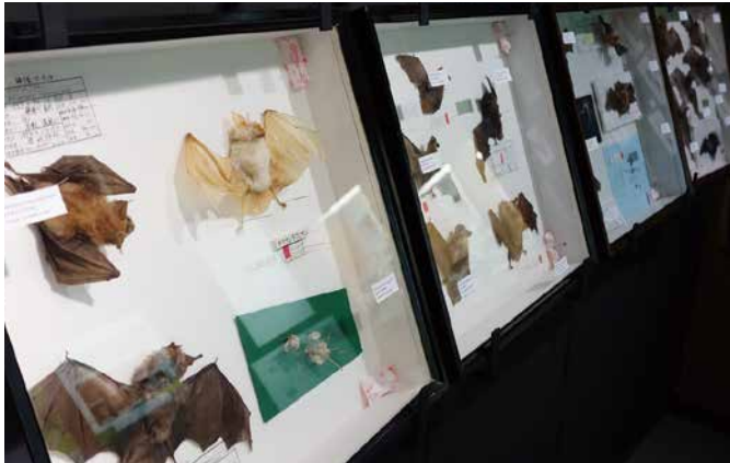
コウモリ標本の数々 (左にアルビノ個体)