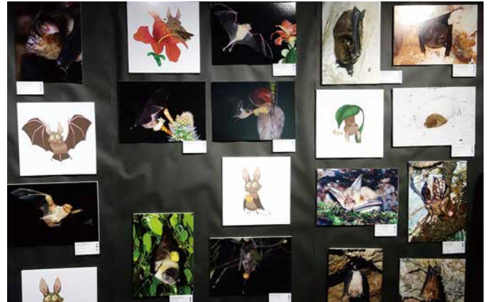
コウモリの生態写真を多数展示

は、色分けしたコウモリの折り紙をたくさんぶら下げました。これは、洞窟の入り口から奥にかけて生息する種が違うことを表しています。