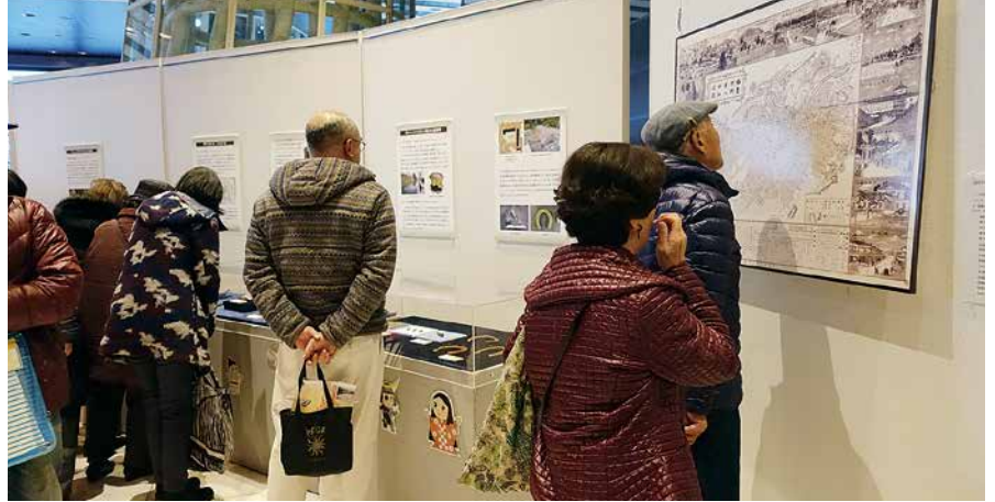
講演後には多くの方々が改めて展示を観覧