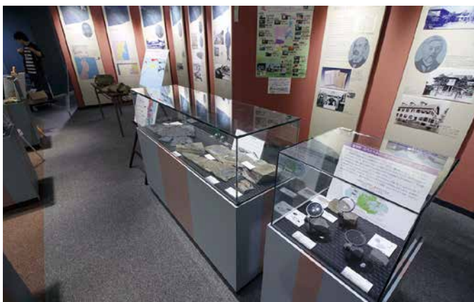
新発見の魚竜化石の標本や囊頭類の化石を展示