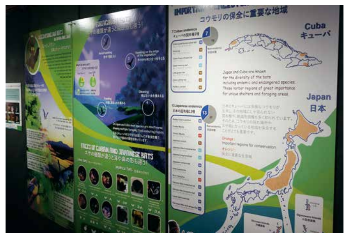
子どもにもわかりやすくて解説パネル(2か国語)