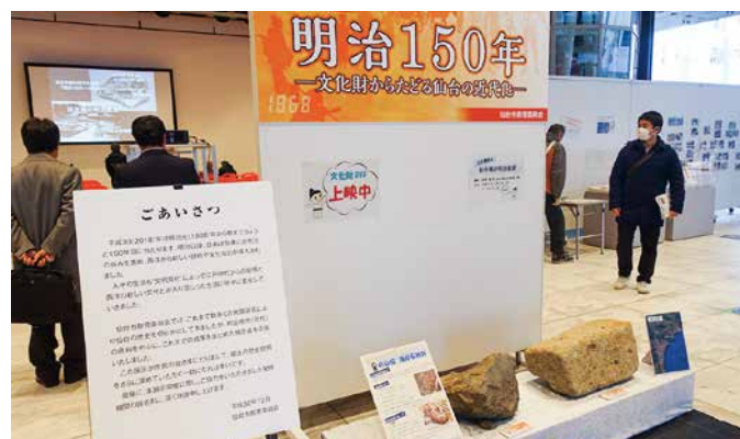
「明治150年 文化財からたどる仙台の近代化」会場入口

ただし、第二師団で兵士の生活は明治末期までは近代的といえるものではなかったそうです。それは使用されていた食