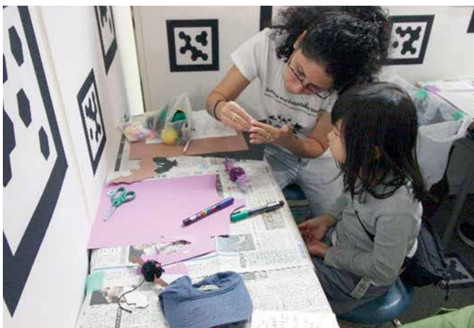
「コウモリたちとハロウィン!」での小もの作り