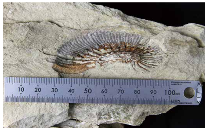
引き伸ばされた石巻市水沼の橋浦層群大和田層(中期ジュラ紀)のアンモナイト化石