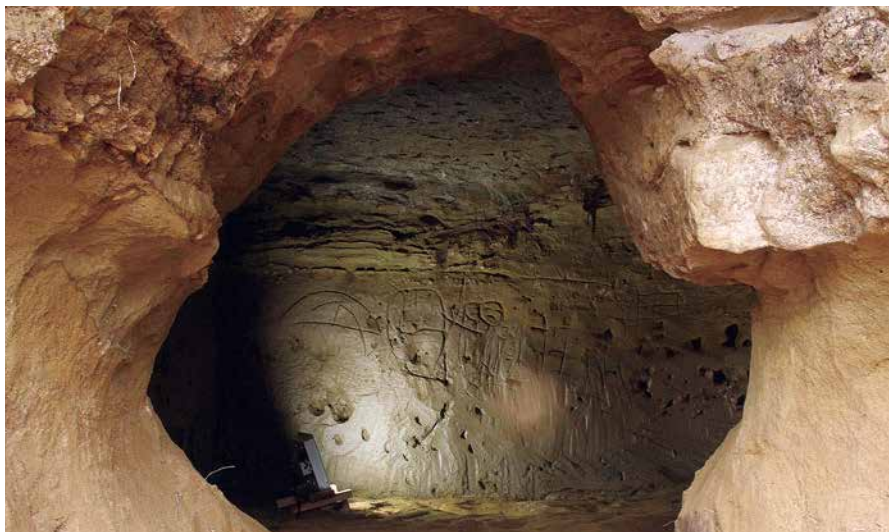
① 調査時の 38 号横穴墓（2017 年 7 月の一般公開時）