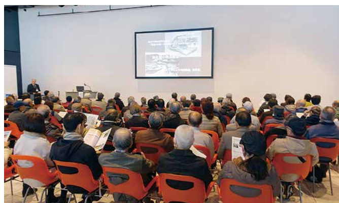
記念講演会場は満席