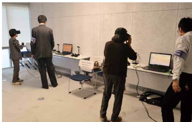
③ 線刻壁画横穴の VR 体験のようす