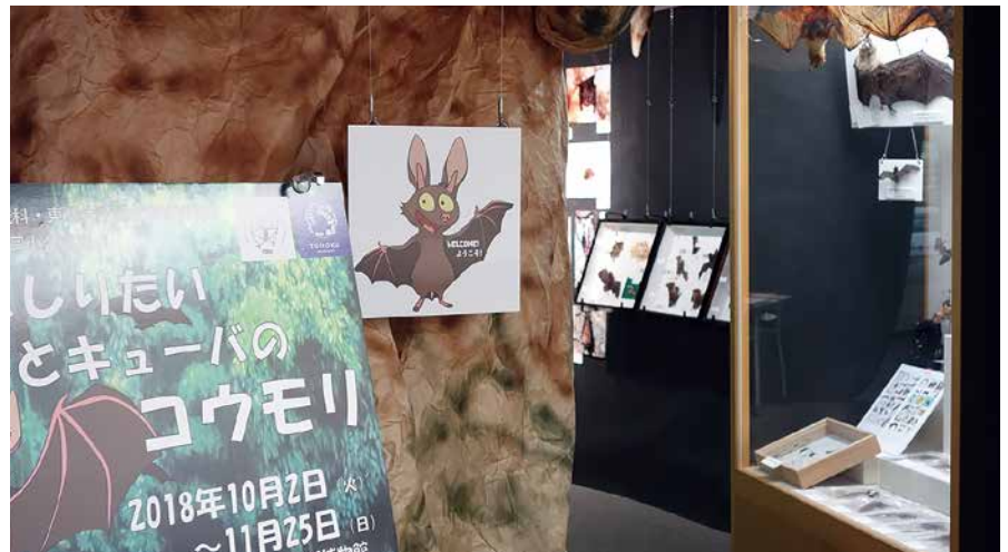
コウモリの棲む洞窟に見立てた展示会場