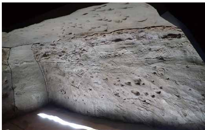
② 山元町歴史民俗資料館に移設された線刻壁画